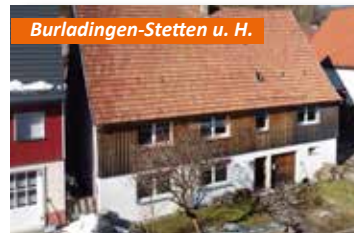
Burladingen-Stetten u. H.