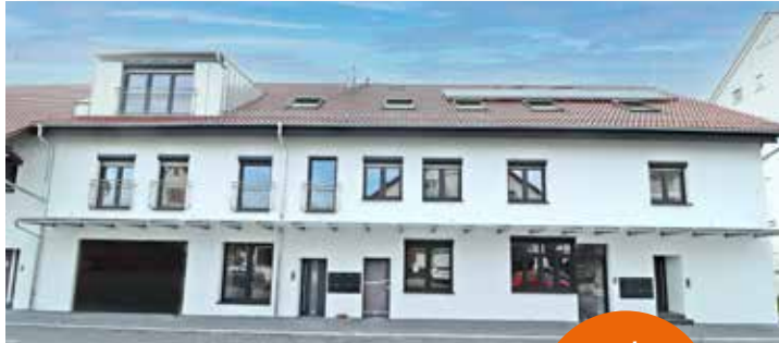
Beispielwohnung: Obergeschoss Wohnung 3